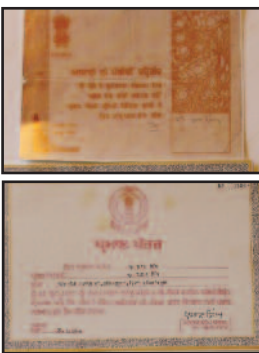
ਅਜ਼ਾਦੀ ਲਈ ਅਤੇ ਕੰਮ ਲਈ ਸੰਘਰਸ਼ ਕਰਨ ਵਾਲੇ ਬਿਆੜਾ ਪਰਿਵਾਰ ਨੂੰ ਮਿਲੇ ਮਾਣ-ਸਨਮਾਨ ਅਤੇ ਤਾਮਰ ਪੱਤਰ