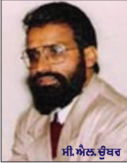
ਸੀ. ਐਲ. ਚੁੰਬਰ

ਅੰਤ ਵਿਚ ਅਸੀਂ ਗੁਰੂ ਕਬੀਰ ਜੀ ਨੂੰ ਯਾਦ ਕਰਦਿਆਂ ਉਹਨਾਂ ਦੇ ਫੁਰਮਾਨ ਨੂੰ ਆਪਣੇ ਮਨ ਵਿਚ ਧਿਆਈਏ ਅਤੇ ਉਸ ਉਪਰ ਚੱਲੀਏ- ਕਬੀਰਾ ਜਬ ਹਮ ਆਏ ਜਗਤ ਮੇਂ, ਜਗ ਹੰਸੇ ਹਮ ਰੋਏ। ਐਸੀ ਕਰਨੀ ਕਰ ਚਲੋ, ਹਮ ਹੰਸੇ ਜੱਗ ਰੋਏ। (ਮਾਣਯੋਗ ਸ੍ਰੀ ਸੀ. ਐਲ. ਚੁੰਬਰ ਸਾਹਿਬ ਜੀ ਦੀ ਅਣਛਪੀ ਰਚਨਾ ਅਸੀਂ ਸੰਪਾਦਕੀ ਦੇ ਰੂਪ ਵਿਚ ਪੇਸ਼ ਕਰ ਰਹੇ ਹਾਂ।)